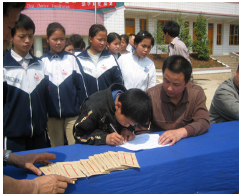
唐力初中贫困住校生正在等待签字收领助学金