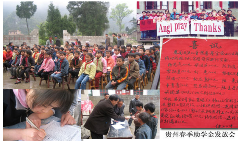
贵州春季助学金发放会