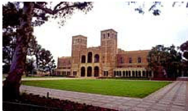
(UCLA: Royce Hall from across the quad)