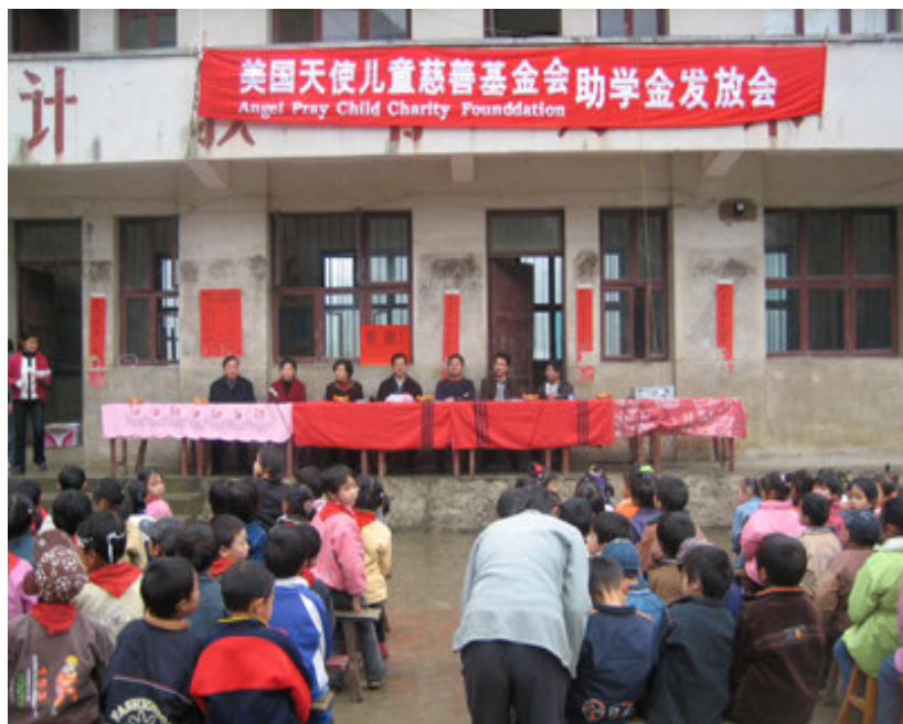
五和小学助学金发放会