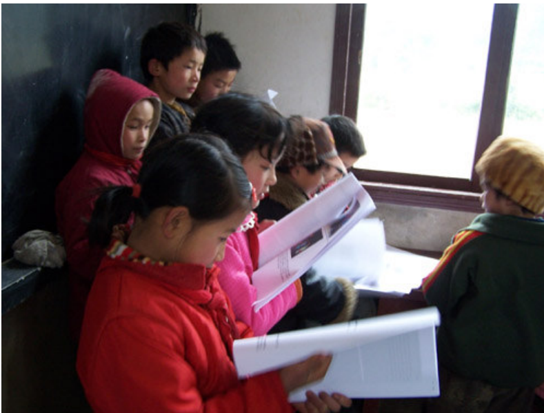
新年晚餐，五和小学的同学正在阅读寸草心新年专刊。